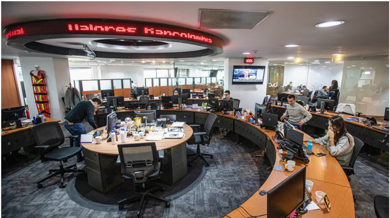
Las acciones colombianas, pese a que han recuperado valor, hoy se negocian a 0,8 veces su valor en libros, uno de los indicadores más bajos de la región, que igualmente implica una oportunidad de entrada.

Tras cuatro años consecutivos de pérdidas, las acciones colombianas terminaron un 2024 excepcional , en el que no solo recuperaron algo de sus precios, sino que se destacaron en América Latina y a nivel global. En promedio, sus precios aumentaron 15,4 % y si se incluyen los dividendos, la rentabilidad sube a 25,5 %.