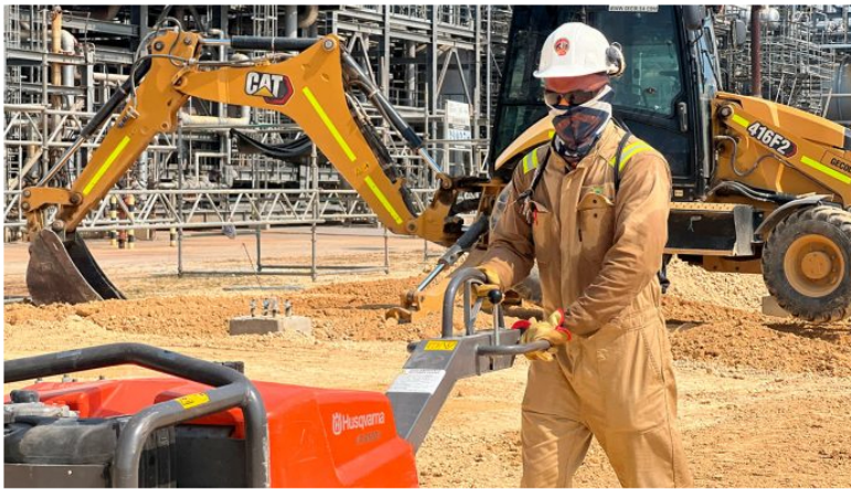
Ecopetrol generó 88 mil empleos por contrato en 2024, 89 % en mano de obra local

El Grupo Ecopetrol ratificó su política de contratación local en las regiones donde hace presencia operativa.