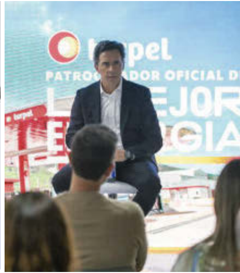
En 2025, las empresas de la Bolsa de Valores de Colombia proyectan atractivos dividendos, con Ecopetrol, Bancolombia y Terpel destacándose como opciones rentables.

El índice MSCI Colcap, que mide los principales activos listados en la Bolsa de Valores de Colombia, cerró el año anterior con un crecimiento del 15,4%.