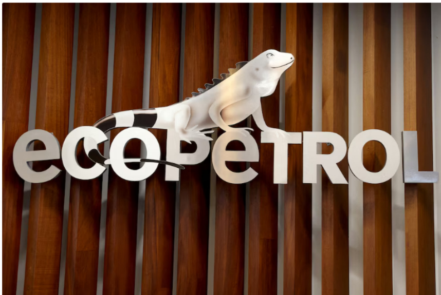
El presidente de Ecopetrol añadió que, igualmente, han apoyado a la población desplazada con elementos básicos de higiene y alimentos

Por su parte, Centrales Eléctricas de Norte de Santander (Cens), filial del Grupo EPM, informó que el servicio de energía eléctrica se presta sin interrupciones mayores. Sin embargo, las cuadrillas operan de manera restringida en zonas de alta conflictividad, priorizando incidentes de alto impacto en municipios como Tibú, El Tarra, Teorama y Sardinata.