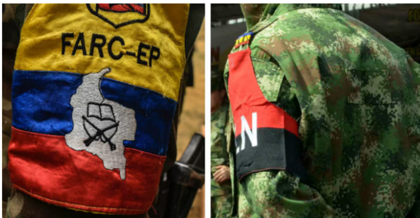
El ELN y el Frente 33 de las disidencias de Farc intensifican el conflicto en el Catatumbo, dejando miles de desplazados y comunidades confinadas