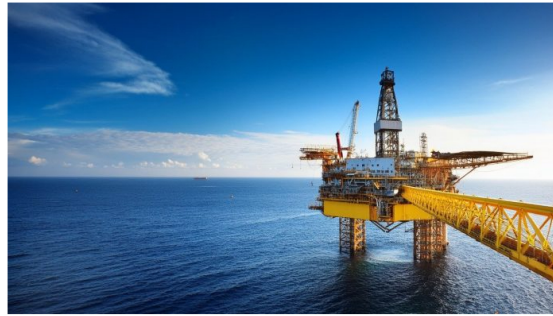
Uchuva II ahora es Sirius II y el Bloque Tayrona tiene un nombre diferente.