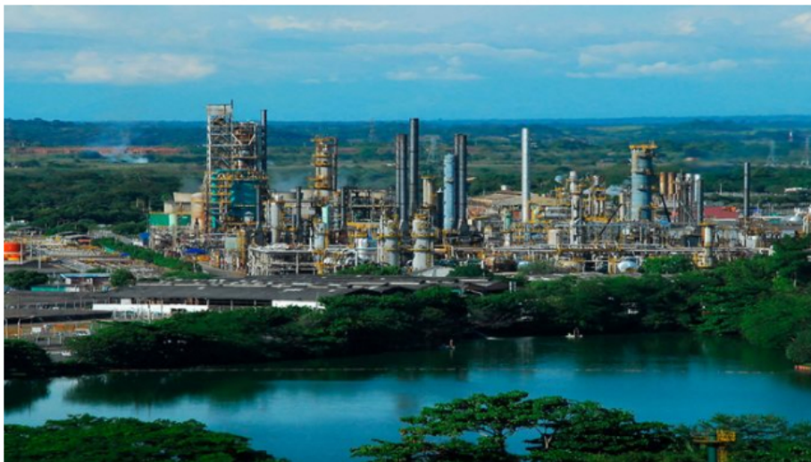
Ecopetrol mantendrá la operación de sus tres plantas regionales de Norte de Santander

El Gobierno nacional garantizó el suministro de combustible en la región del Catatumbo, donde se registra una crisis humanitaria por cuenta de los grupos armados ilegales.