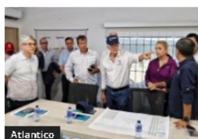
Atlántico Gobernación del Atlántico y grupo