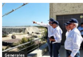
Generales Gobernación del Atlántico y grupo