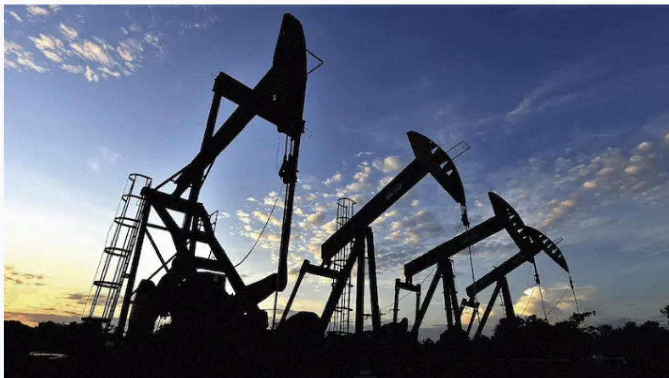
Petróleo, Colombia.

Forbes Staff | enero 20, 2025 @ 5:01:00 am