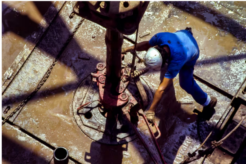
Imagen de referencia.