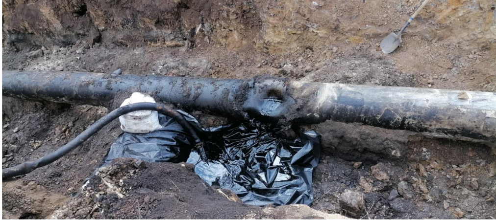
Oleoducto Caño Limón.