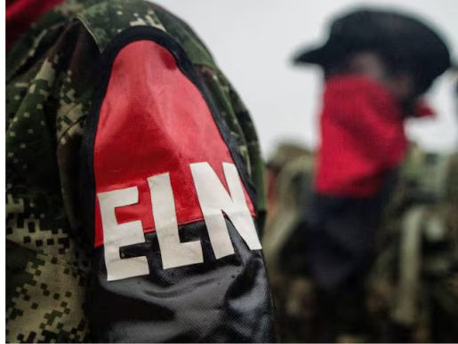
El ELN- (Getty Images)

Se trata de un comunicado del ELN en el cual decía que "seguirá corriendo sangre en el Catatumbo" si el autodenominado comandante Richard no se entregaba.