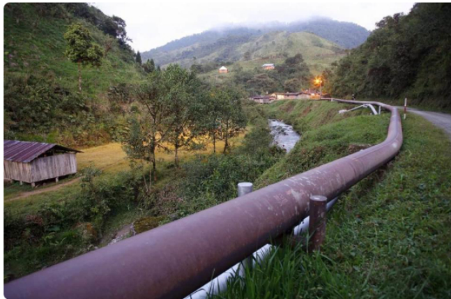
Cenit desmiente supuesto desmantelamiento de infraestructura del Oleoducto Trasandino.

Cenit, filial del Grupo Ecopetrol , informó que mantendrá suspendida la operación del Oleoducto Trasandino (OTA), luego de un exhaustivo análisis de la situación actual de entorno y seguridad en las zonas de los departamentos de Nariño y Putumayo donde se encuentra ubicada esta infraestructura de transporte de petróleo .