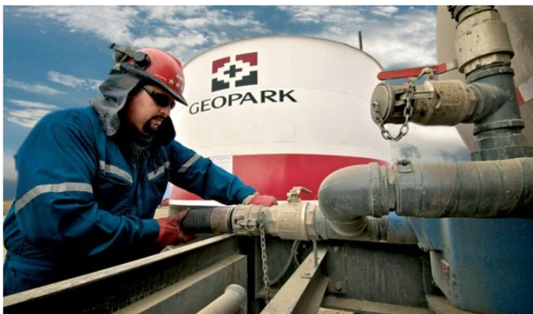
Ningún activo de Repsol Colombia será para GeoPark: Hay anuncio para proyectos en Arauca.

El 29 de noviembre de 2024, GeoPark Limited había anunciado la firma de Acuerdos de Compra y Venta (SPAs) con Repsol Exploración SA y Repsol E&P SARL para adquirir los activos upstream de petróleo y gas en Colombia, pero las cosas no salieron de acuerdo con el plan. ¿Por qué?