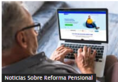
Noticias Sobre Reforma Pensional

¿Qué tan alto podrá ser el pago de la pensión en Colombia con el nuevo sistema de jubilaciones?