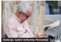
Noticias Sobre Reforma Pensional

¿Qué tan alto podrá ser el pago de la pensión en Colombia con el nuevo sistema de jubilaciones?