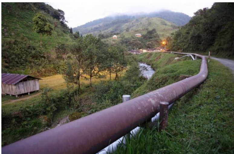
Cenit desmiente supuesto desmantelamiento de infraestructura del Oleoducto Trasandino.

Cenit, filial del Grupo Ecopetrol , informó que mantendrá suspendida la operación del Oleoducto Trasandino (OTA), luego de un exhaustivo análisis de la situación actual de entorno y seguridad en las zonas de los departamentos de Nariño y Putumayo donde se encuentra ubicada esta infraestructura de transporte de petróleo .