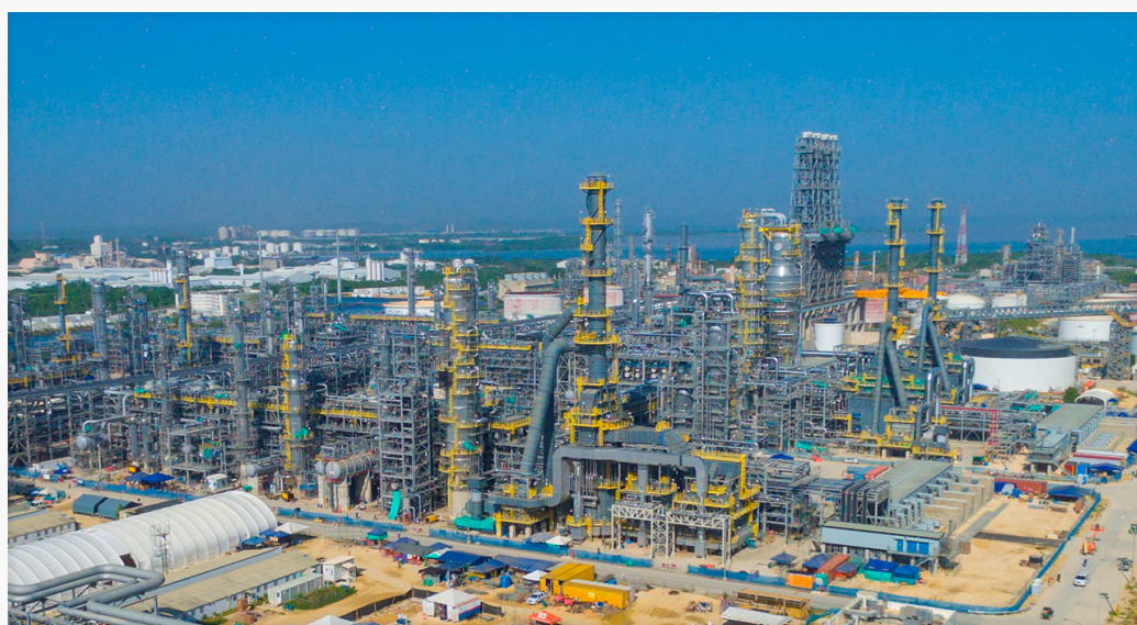
Tribunal internacional inadmite demanda de empresas de EE. UU. contra el país y ratifica que caso Reficar debe ser resuelto por justicia colombiana