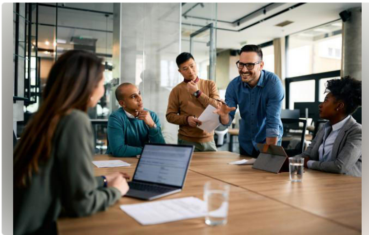
Ofertas de trabajo para AR temporal