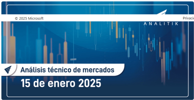
Acciones de Grupo Éxito cayeron a precios no vistos desde el año 2004 – Enero 15 de 2025

Historia de Valora Analitik • 1 h • 2 minutos de lectura