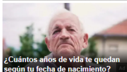
¿Cuántos años de vida te quedan según tu fecha de nacimiento?