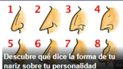
Descubre qué dice la forma de tu nariz sobre tu personalidad