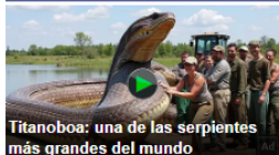
Titanoboa: una de las serpientes más grandes del mundo