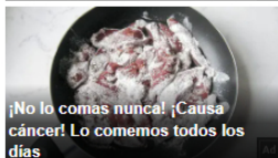
¡No lo comas nunca! ¡Causa cáncer! Lo comemos todos los días