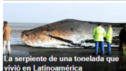
La serpiente de una tonelada que vivió en Latinoamérica