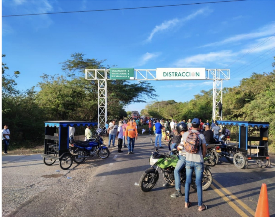
Foto referencia de los bloqueos en La Guajira.