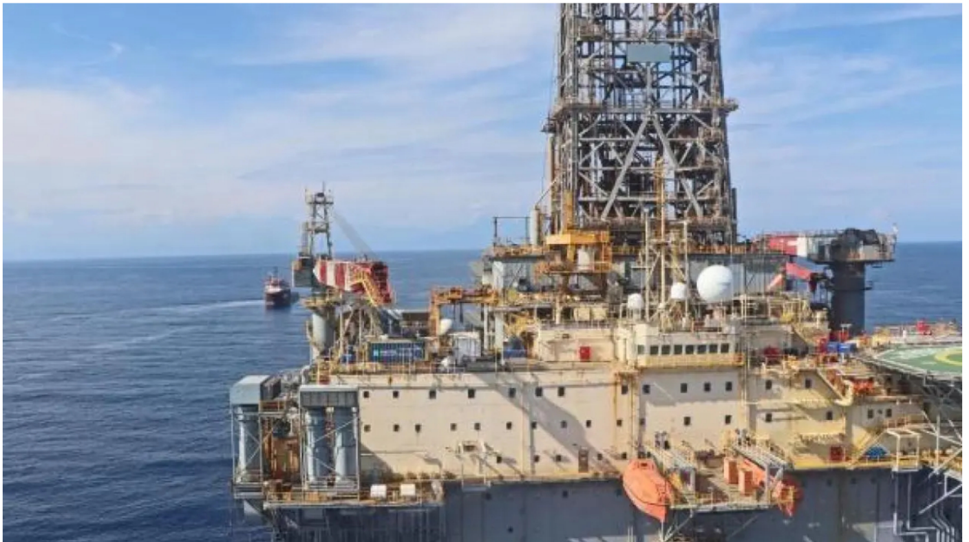
Pozo Sirius-2 de Ecopetrol y Petrobras