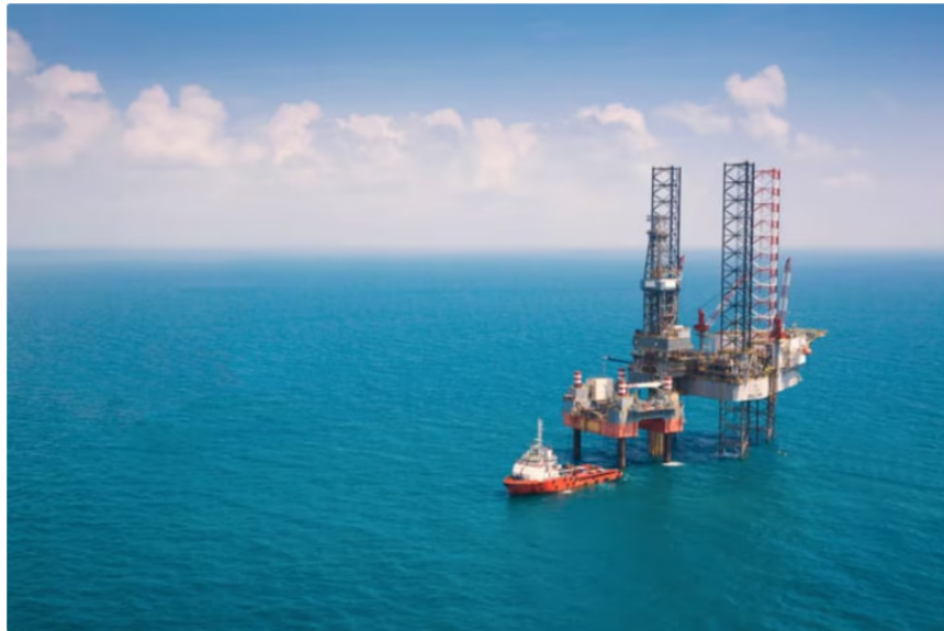
Ecopetrol explora gas en el Caribe colombiano desde hace bastante tiempo

El gasoducto Komodo-1, considerado uno de los proyectos clave para la autosuficiencia energética de Colombia y con el objetivo de explotar gas en una de las perforaciones más profundas del mundo, enfrenta un complejo panorama debido a las estrictas exigencias impuestas por la Autoridad Nacional de Licencias Ambientales (Anla).