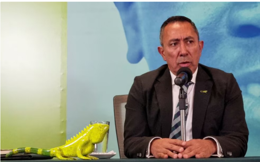
Ricardo Roa ha enfrentado varios problemas como presidente de Ecopetrol

Según informaron las empresas a la Autoridad Nacional de Licencias Ambientales, “estas restricciones afectan no solo a Komodo-1, sino también a otros desarrollos de perforación offshore estratégicos para el país” . Para Colombia, esto resulta muy delicado en un momento en que, por primera vez en 45 años, el país se vio obligado a importar gas para satisfacer una demanda esencial que involucra hogares, pequeños comercios y transporte interno.