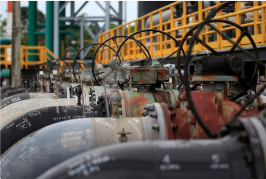
Colombia empezó a importar gas en diciembre de 2024 ante el déficit que hay en el país

Ambas empresas advirtieron, también, que este retraso podría posponer la entrega del gas extraído a partir de este pozo, que un principio está prevista para 2026.