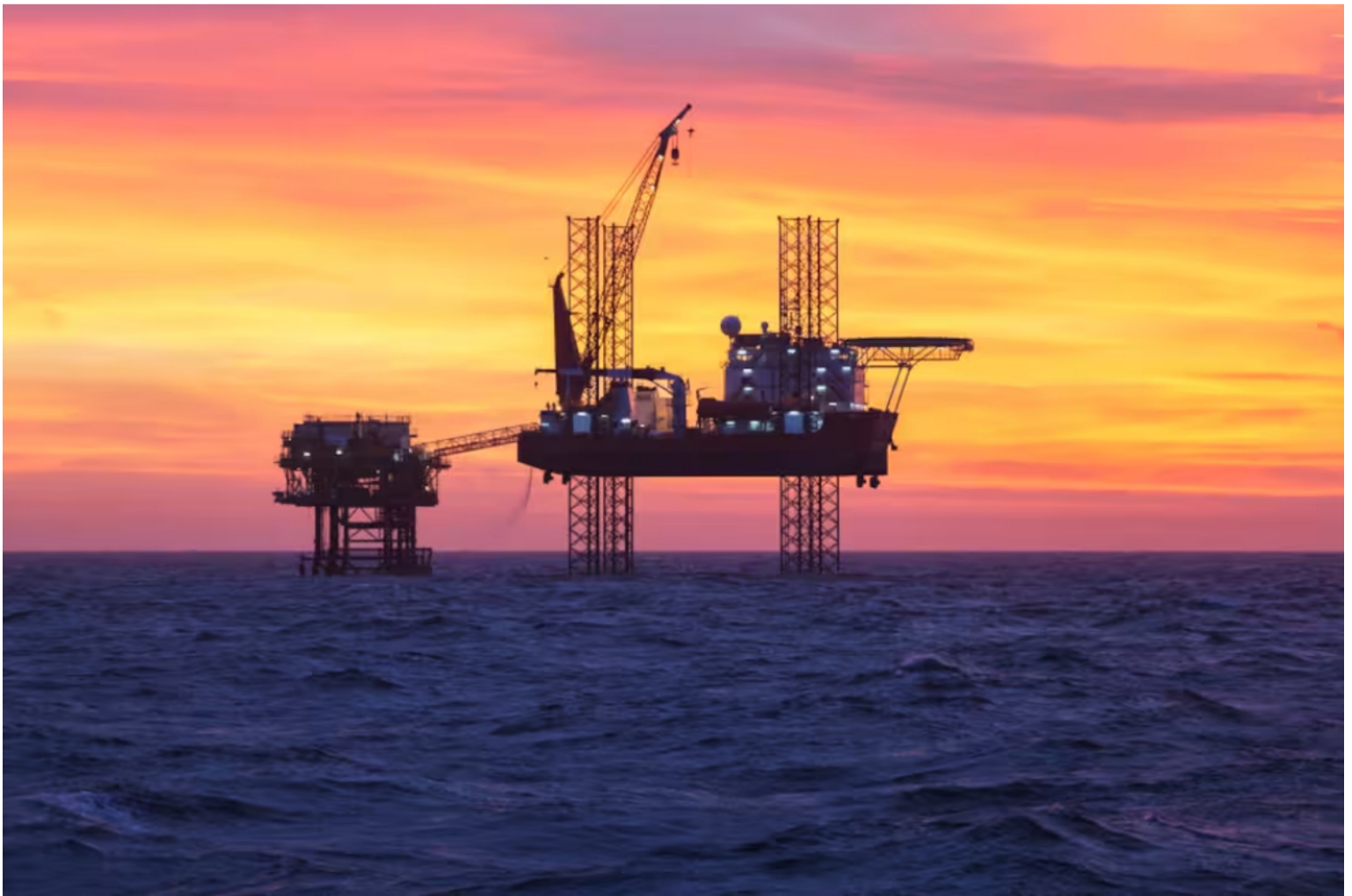
(Imagen de referencia) Mediante este recurso se espera que la ANLA revise los términos y, eventualmente, modifique las condiciones para la exploración del pozo.