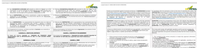
Según el contrato revelado, Ecopetrol busca importar hasta 100 Gbtu diarios de gas venezolano para 2025

• Valor del contrato: el monto total asciende a veinte mil dólares estadounidenses USD20.000, sin incluir el IVA —como previamente se mencionó—. Este valor corresponde al costo completo por los servicios contratados. Además, Ecopetrol no se compromete a solicitar un mínimo o máximo de servicios, y pagará únicamente por aquellos que hayan sido ejecutados a su entera satisfacción.