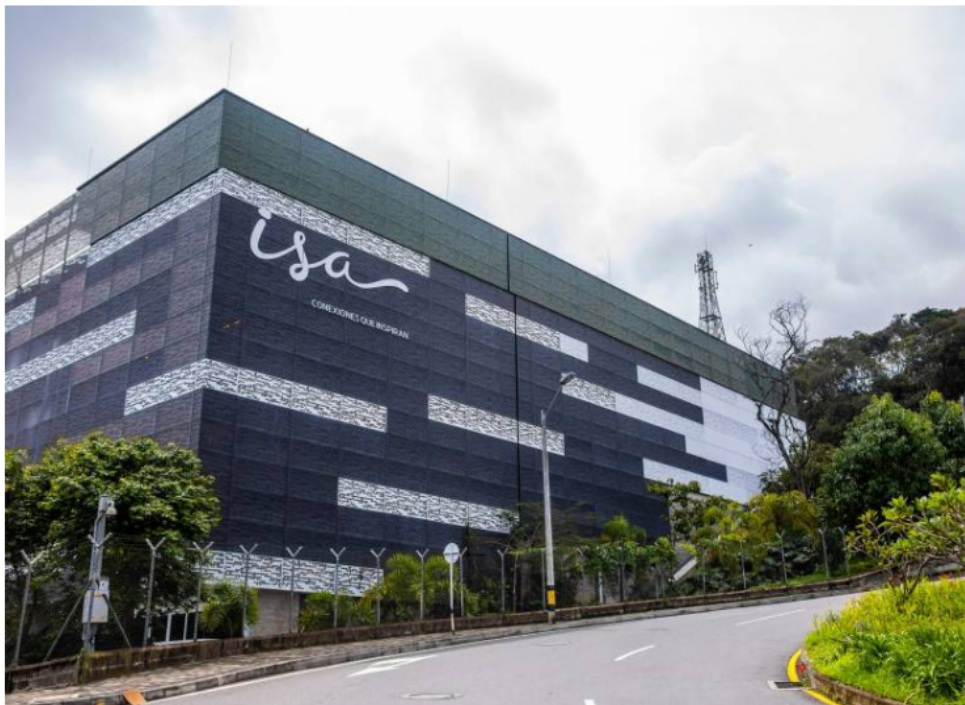
ISA, filial de Ecopetrol , tiene como domicilio principal la ciudad de Medellín; se constituyó como sociedad anónima por escritura pública de la Notaría Octava del Círculo Notarial de Bogotá, el 14 de septiembre de 1967.

La iniciativa sería sometida a consideración de la asamblea de accionistas.