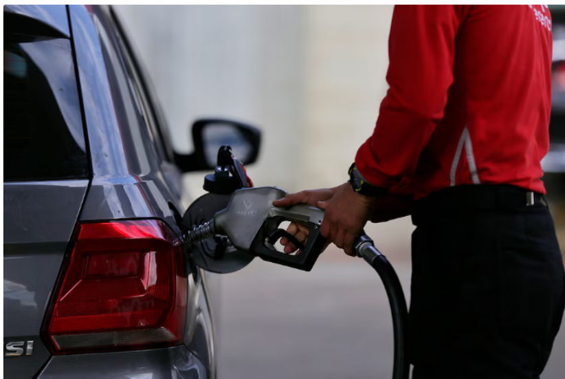
El Gobierno Petro hizo alzas mes a mes en el precio del galón de gasolina corriente para cerrar el billonario déficit del Fepc

Uno de los asuntos económicos que más ha causado polémica en lo que va del gobierno de Gustavo Petro es el precio del galón de gasolina corriente, así como el del diésel (Acpm). Esto, debido a que el mandatario tuvo que establecer alzas mensuales para cerrar el billonario déficit del Fondo de Estabilización de Precios de los Combustibles (Fepc), lo que llevó a que la corriente esté, en promedio, en cerca de $16.000, luego de haberlo recibido, en 2022, en un poco más de $8.000.