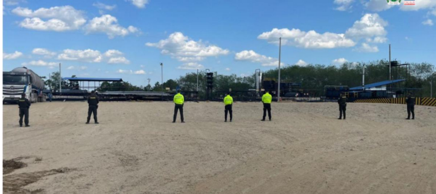
Fiscalía toma los bienes de 'La empresa', la banda dedicada a robar hidrocarburos

La Fiscalía dictó medidas cautelares sobre nueve bienes valorados en más de 7.000 millones de pesos.