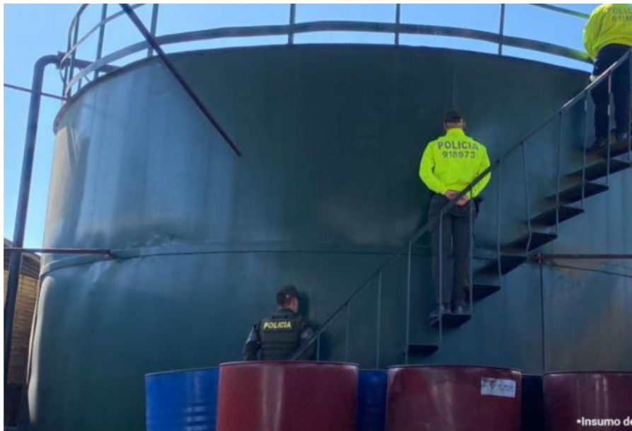
Fiscalía toma los bienes de 'La empresa', la banda dedicada a robar hidrocarburos

Sobre estas estaciones también cayeron las autoridades y capturaron a una pareja que figuraban como propietarios y quienes al parecer hacían parte de la red delincencial.