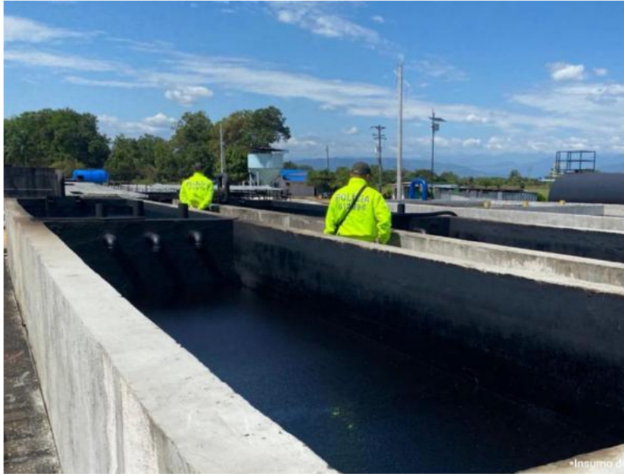
Fiscalía toma los bienes de 'La empresa', la banda dedicada a robar hidrocarburos

Alias Juan Carlos, líder de la banda y propietario de varias estaciones de servicio; alias El Costeño, su socio distribuidor; alias Gonzalo, el dueño del tractocamión; y seis presuntos integrantes de la banda fueron capturados y judicializados. Se les imputaron los delitos de concierto para delinquir en concurso con apoderamiento de hidrocarburos.