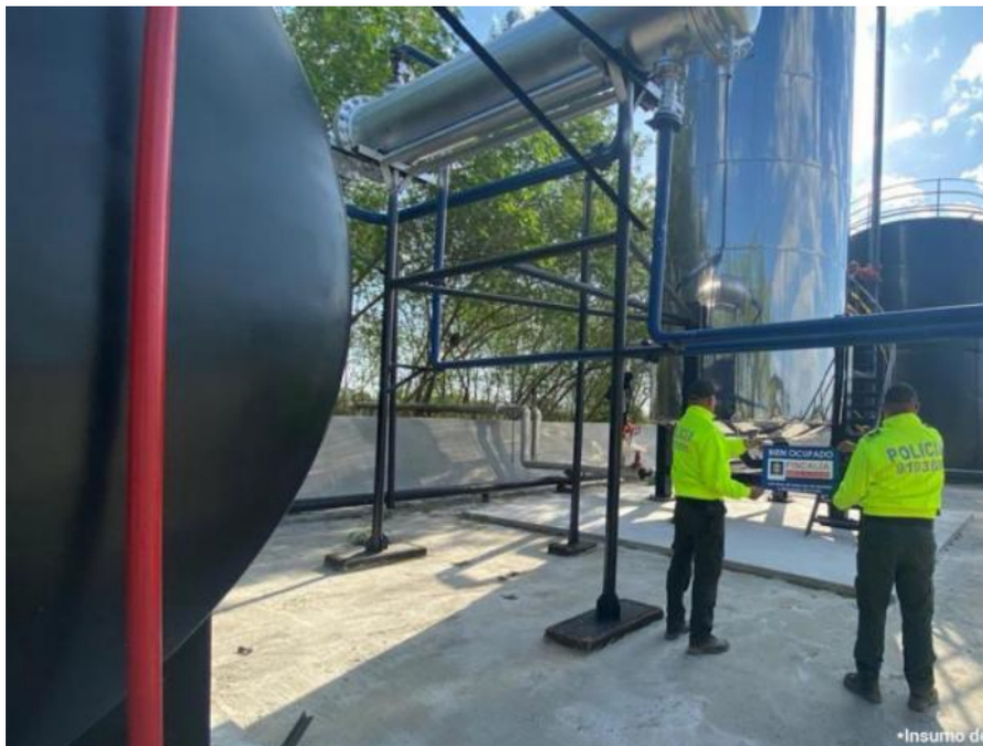
Fiscalía toma los bienes de 'La empresa', la banda dedicada a robar hidrocarburos

"De acuerdo con los elementos materiales probatorios, 'La Empresa' utilizaba guías de transporte falsas para movilizar los combustibles obtenidos ilícitamente y evitar que fueran detectados por las autoridades. Asimismo, constituyó empresas para darles apariencia de legalidad a los productos y venderlos", informaron desde la Fiscalía.