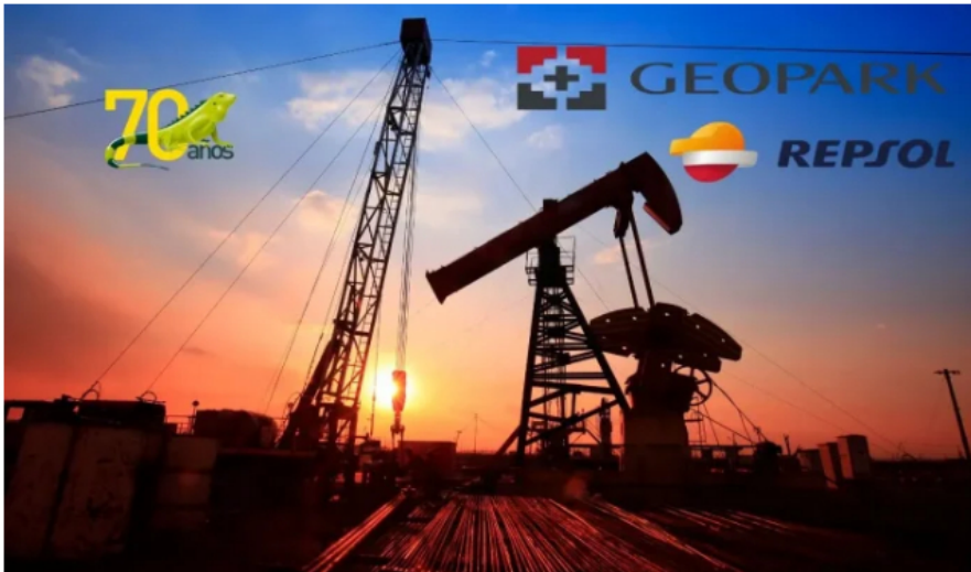
Ecopetrol cancela acuerdo de GeoPark y asegura bloque clave en los Llanos.

Ecopetrol ha reforzado su posición como uno de los actores clave en la industria de hidrocarburos en Colombia tras ejercer su derecho de preferencia y adquirir el 45% restante de la participación de Repsol en el bloque CPO-09 , ubicado en el Piedemonte Llanero.