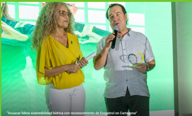
"Acuacar lidera sostenibilidad hídrica con reconocimiento de Ecopetrol en Cartagena"