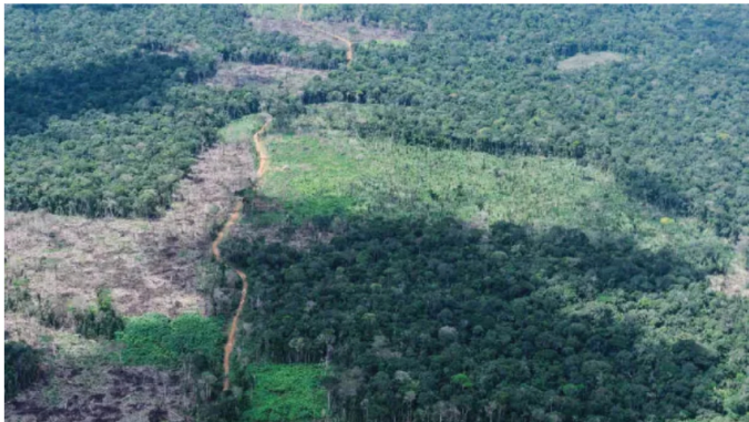
Deforestación en la Amazonia colombiana cayó 25% entre enero y septiembre de 2025