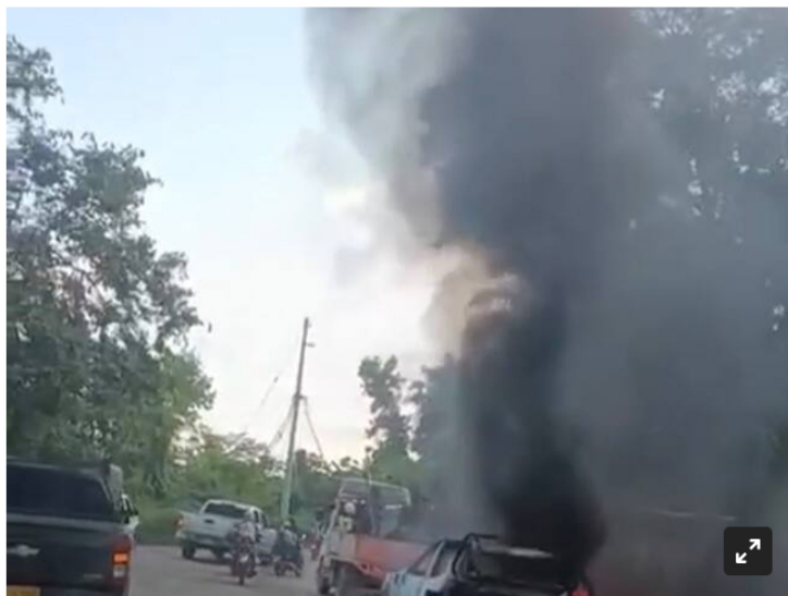
Un vehículo fue incinerado en la vía Tibú-La Gabarra.

Un vehículo que atendían una emergencia sobre una línea de transferencia de crudo, fue incinerado.