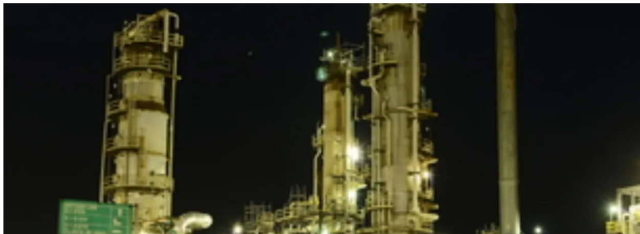
sobre gas natural.