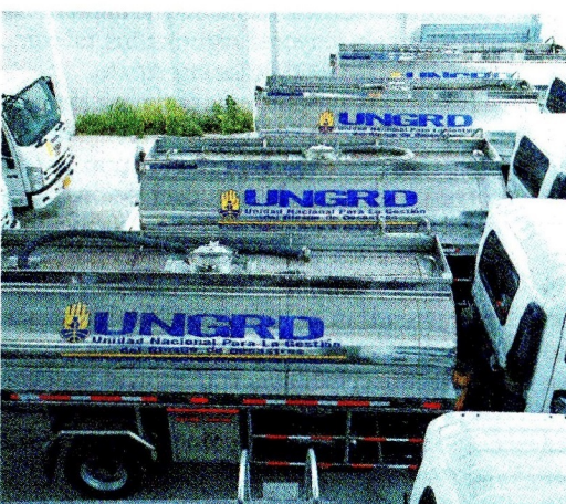
Dos exministros están en la cárcel por el caso Ungrd. /Mauricio Alvarado