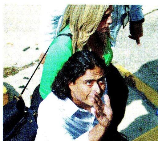
Nicolás Petro es investigado por presunto enriquecimiento ilícito.