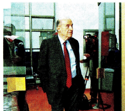
Álvaro Leyva , exministro de Relaciones Exteriores.