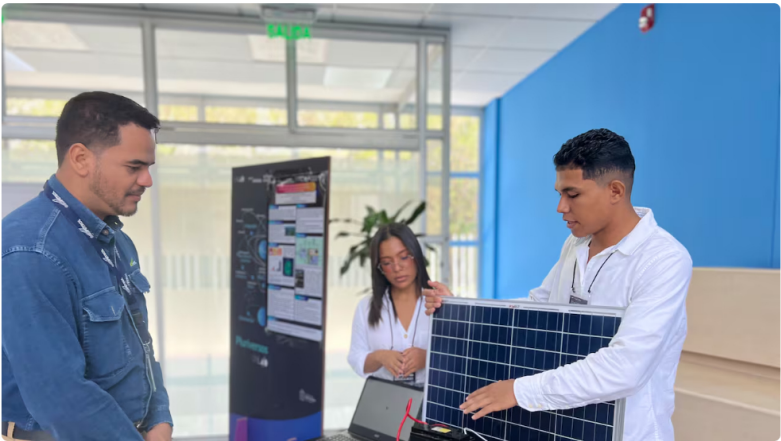
En alianza con la Universidad Nacional de Colombia, este programa liderado por Ecopetrol impulsa las capacidades.

En un país donde la desigualdad restringe las oportunidades de miles de personas, iniciativas como Jóvenes 4.0 abren caminos distintos. Desde su creación, este programa, impulsado por Ecopetrol en alianza con el Laboratorio UNLAB 4.0 de la Universidad Nacional de Colombia, ha beneficiado a 21.297 jóvenes entre los 14 y 28 años en 17 municipios de ocho departamentos. Más allá de las cifras, la iniciativa se consolida como un laboratorio social que articula innovación, creatividad, ciencia y tecnología para fortalecer capacidades y potenciar vocaciones en nuestros territorios.