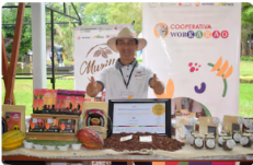
Con cacao premiado en Europa, los Llanos Orientales impulsan un giro histórico para el campo