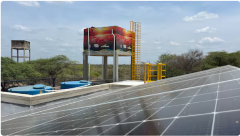
En La Guajira, el proyecto también incluyó la instalación de paneles solares.

En Norte de Santander, Ecopetrol habilitó infraestructura complementaria del Acueducto Metropolitano de Cúcuta, lo que aumentó en 1,0 m³/s la capacidad de tratamiento de la Planta El Pórtico. Durante 2025 también se iniciaron cuatro nuevos proyectos en Puerto Wilches (Santander), Aipe (Huila), Uribia (La Guajira) y Cartagena (Bolívar), con los que se beneficiará a 13 mil habitantes, en su mayoría de zonas rurales.