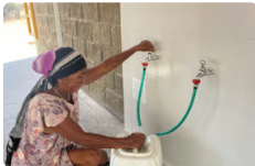
Ecopetrol invierte en agua, gas y energía para dignificar la vida de las comunidades y acelerar el desarrollo territorial