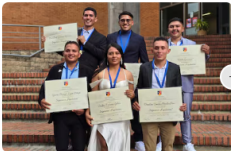
Formar talento para transformar regiones: una apuesta de largo plazo en educación superior

Mejor Colombia Nación Política Dinero Mundo Deportes Tecnología Gente