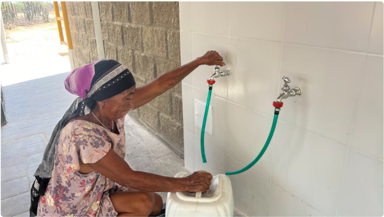
La Guajira ha sido uno de los departamentos más beneficiados con el proyecto de acceso al agua potable y saneamiento básico de Ecopetrol.

En Colombia, 1,6 millones de hogares aún cocinan con leña y más de cinco millones de personas no tienen acceso a agua potable. La carencia de servicios públicos básicos como agua, energía y gas profundiza las condiciones de vulnerabilidad, con impactos directos en la salud, especialmente en niños y mujeres, al aumentar la incidencia de enfermedades gastrointestinales y respiratorias. Más allá de una necesidad técnica, el acceso a estos servicios es un factor determinante para la dignidad humana, la calidad de vida y el desarrollo social, al liberar tiempo para la educación, el trabajo y el cuidado familiar.