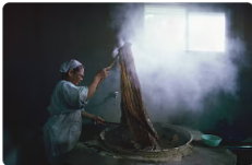
Los agüeros menos conocidos que se hacen en Colombia para recibir el Año Nuevo