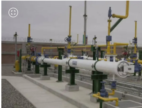
Ecopetrol dispuso de más gas al mercado nacional.

Y la disposición de la molécula se realiza en el marco de las acciones que desarrolla la empresa para contribuir al abastecimiento de este energético en el país.