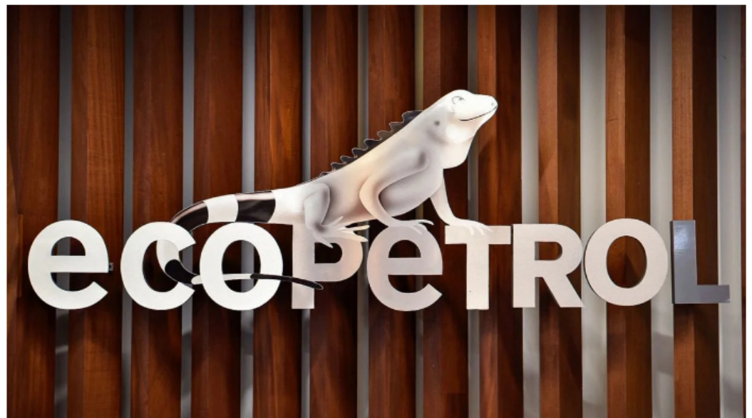
Empresa Colombiana de Petróleos ( Ecopetrol ).

Ecopetrol asumió el 100 % de la participación y la operación de varios bloques costa afuera en el Caribe Sur, tras la formalización de la cesión que hizo Shell ante la Agencia Nacional de Hidrocarburos (ANH).