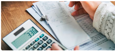
Algunas calificadoras, como Fitch, ven riesgos en Ecopetrol.