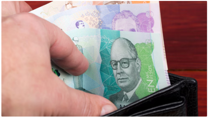
Expertos aseguran que la subida en el precio de los combustibles impacta la inflación

Según la circular, "la presente publicación se efectúa considerando el valor del ingreso al productor o importador de la Gasolina Motor Corriente, el del Acpm-Diésel y el de los biocombustibles destinados a la mezcla con combustibles fósiles, fijados por los Ministerios de Hacienda y Crédito Público y de Minas y Energía, conforme lo establecido por la Resolución 40193 de 2021".