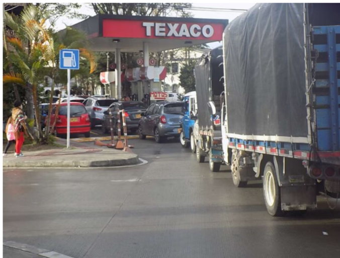
El Gobierno busca ajustar la metodología de ingreso al productor del etanol, lo que reducirá el precio de este combustible en Colombia

Inzacom también destacó que la gasolina acumuló un aumento de $397 (2,47%) durante 2025, por lo que cerró en $16.341 por galón, y que el Acpm sumó una variación de $639 (5,88%), por lo que alcanzó los $11.260 por galón al finalizar el año.