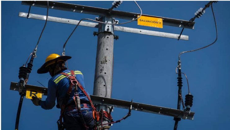
Sector energético en 2025.

Por: Manuel Alejandro Correa - 2025-12-21