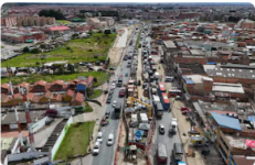
Soacha renace con estas obras: hospital, TransMilenio y cable aéreo transformarán al municipio