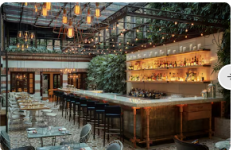
Celebrar con estilo: descubra los planes más exclusivos de este hotel para despedir el año con lujo y bienestar

Mejor ColombiaVida ModernaNaciónGenteTecnologíaPolíticaEconomíaMundo