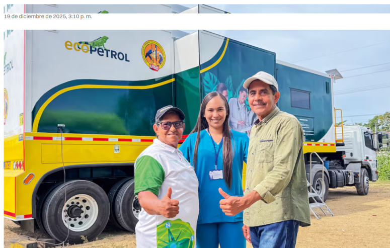
Entre 2023 y 2025, los proyectos de Ecopetrol beneficiaron a más de 1,5 millones de habitantes.

En un país marcado por desafíos sociales, la inversión en proyectos que generan bienestar para las comunidades se ha convertido en un eje clave para avanzar en desarrollo y equidad. En este escenario, Ecopetrol se consolida como uno de los principales agentes de transformación territorial. Entre 2023 y 2025, sus proyectos beneficiaron a más de 1,5 millones de habitantes, con un portafolio de más de 200 iniciativas y una inversión que supera los 1,13 billones de pesos. Estos proyectos se desarrollan en 18 departamentos y más de 53 municipios, y buscan avanzar en el cierre de brechas históricas de desigualdad para generar impactos reales en las comunidades.