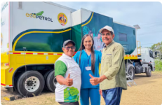
Más de 200 proyectos y 1,5 millones de beneficiados: así invierte Ecopetrol en los territorios