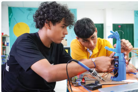
Los resultados muestran una articulación efectiva entre comunidades, sector público y sector empresarial para fortalecer el desarrollo territorial.

Desde la creación del mecanismo de Obras por Impuestos, el Grupo Ecopetrol se ha consolidado como el actor líder con mayor número de proyectos asignados, posicionándose como aliado estratégico del Estado para el desarrollo territorial sostenible. A la fecha, se ha vinculado con 157 proyectos por más de 1,42 billones de pesos, con impactos positivos para cerca de tres millones de personas en los territorios más afectados por el conflicto armado.