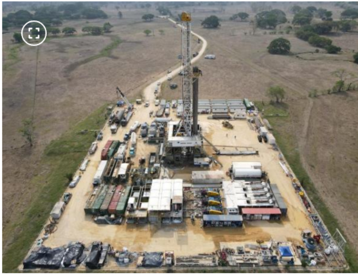
Pozo de Canacol Energy

Es importante tener en cuenta que la producción fiscalizada hace referencia a todo el gas que se extrae del subsuelo , mientras que la producción comercializada es el gas que realmente se entrega en los gasoductos para la venta.