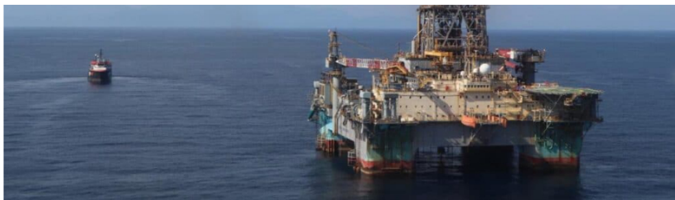
Yacimiento Sirius.

Con ello se cierra un paso clave para avanzar en la entrada en operación de este proyecto. El 30 de octubre de 2025 se acordó este mecanismo de comercialización entre Ecopetrol y Petrobras, con el objetivo de garantizar la asignación del gas producido en el campo.