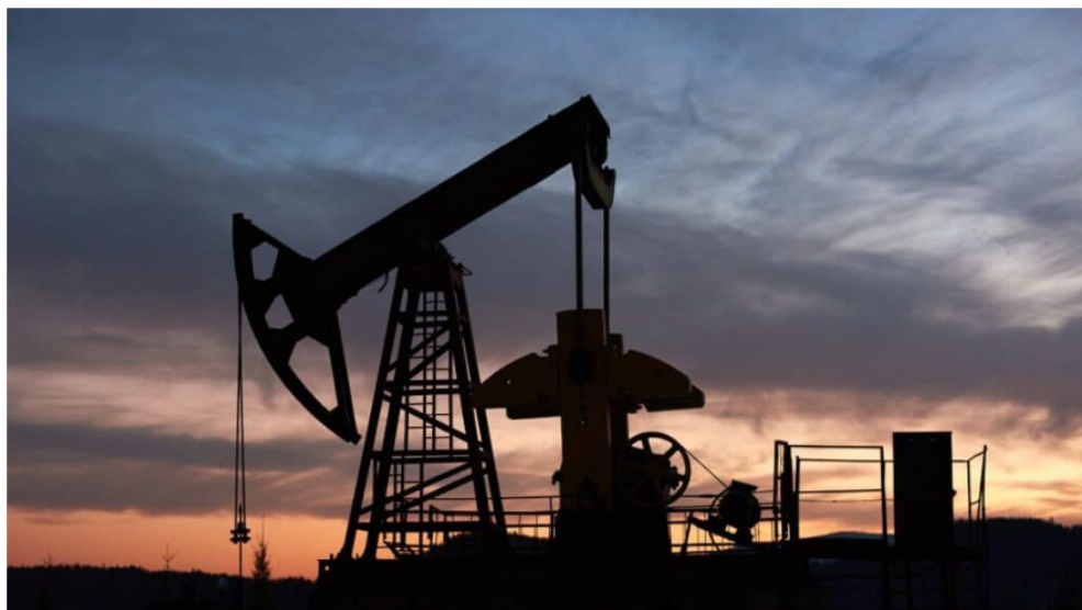
Precio del Brent.

Por: Manuel Alejandro Correa - 2025-12-18