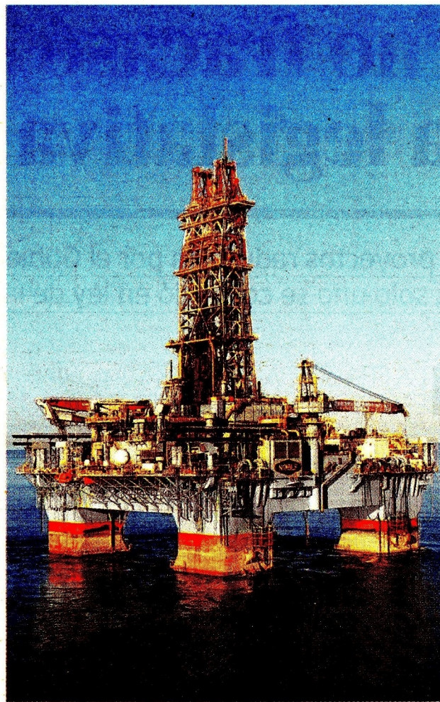
Se realizó la comercialización temprana de Sirius-2.

Según las compañías, el proceso culminó el 12 de diciembre de 2025 con la venta de las cantidades ofrecidas en cada producto: 113 millones de pies cúbicos por día (MPCD) a 6 años, 86 millones de pies cúbicos por día (MPCD) a 5 años y