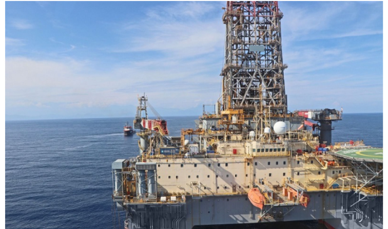
Proceso conjunto de Ecopetrol y Petrobras consolida a Sirius como proyecto energético importante.