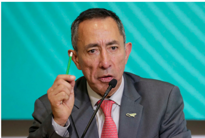
Presidente de Ecopetrol, Ricardo Roa.

El presidente de Ecopetrol, Ricardo Roa, compareció ante la Fiscalía General de la Nación para rendir interrogatorio dentro de la investigación que se adelanta por presuntas irregularidades en la compra de un apartamento de alto valor ubicado en el norte de Bogotá. La diligencia se realizó de manera virtual y fue atendida por una fiscal especializada de la Unidad Nacional contra la Corrupción, luego de una solicitud presentada por el propio directivo.