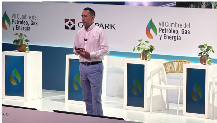
Ricardo Roa se ha aferrado como presidente de Ecopetrol, pese a los escándalos en su contra.

🌟 Siga a EL PAÍS en Google Discover y no se pierda las últimas noticias