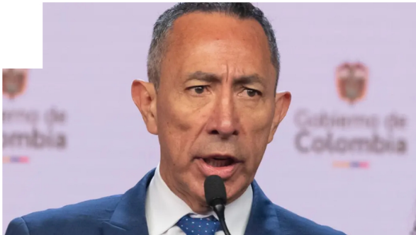
Ricardo Roa en medio de una rueda de prensa en agosto de 2024.

Ahora la Fiscalía debe evaluar esta información y determinar el paso a seguir en el proceso en el que, cabe recordar, está bajo la lupa una operación que habría hecho Roa a través de una empresa vinculada al empresario del sector hidrocarburos Serafino Jácono.