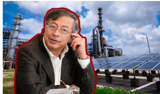
El presidente Gustavo Petro inspecciona los avances del Proyecto Coral en la Refinería de Cartagena.

El presidente Gustavo Petro realizó este viernes una visita técnica a la Refinería de Cartagena para inspeccionar los avances de uno de los proyectos energéticos más ambiciosos que se desarrollan actualmente en América Latina, una iniciativa que busca consolidar a Colombia como referente regional en energías limpias a partir de 2026.