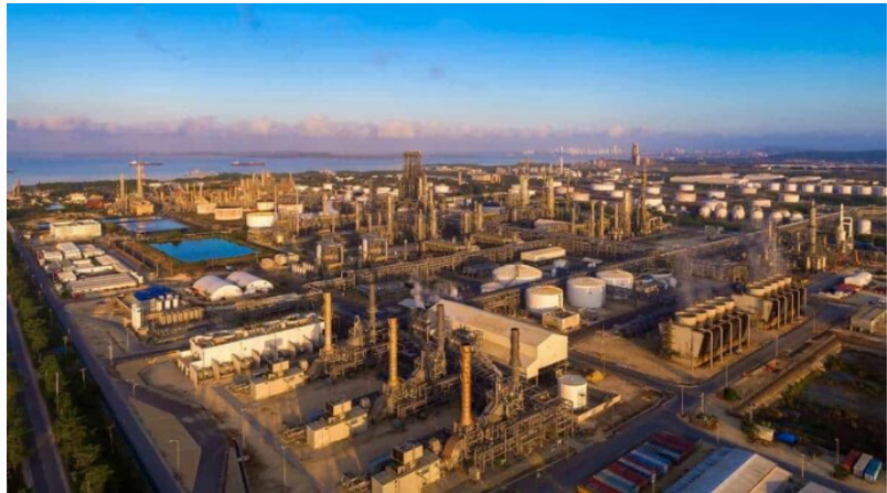
Refinería de Cartagena.

En la misma línea, el exdirector de la DIAN Lisandro Junco sostuvo que la tutela no era el mecanismo adecuado para contravenir este tipo de actuaciones administrativas. En su concepto, la Refinería de Cartagena debe presentar una acción de nulidad y restablecimiento del derecho contra los actos administrativos que dieron origen al cobro, así como promover ante el Consejo de Estado la nulidad de los conceptos en los que se apoya la DIAN para gravar las importaciones de combustibles.