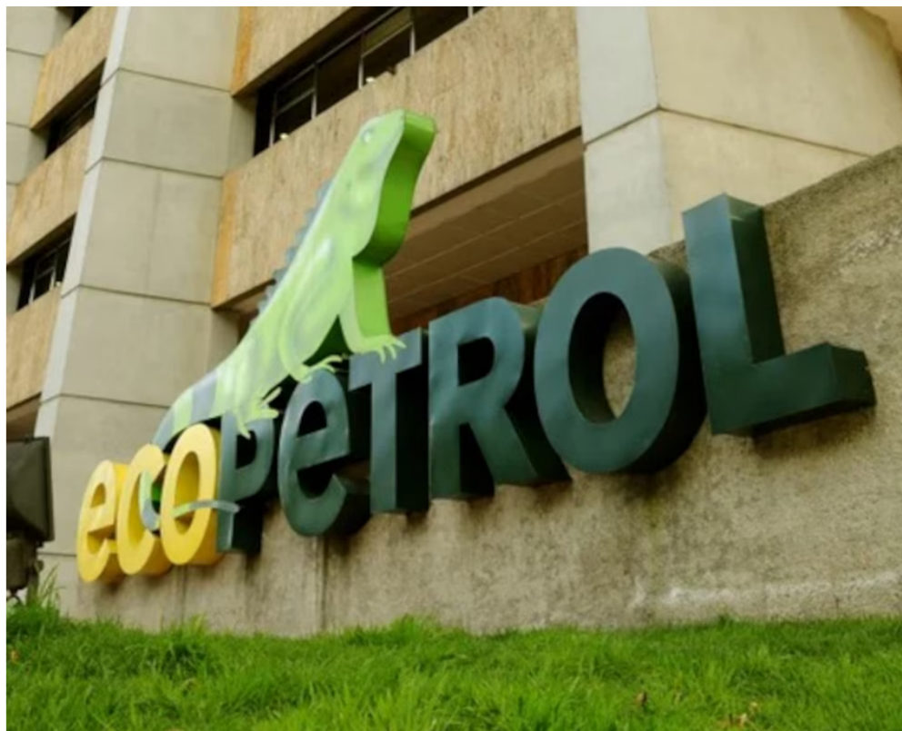
Sede de Ecopetrol en Bogotá