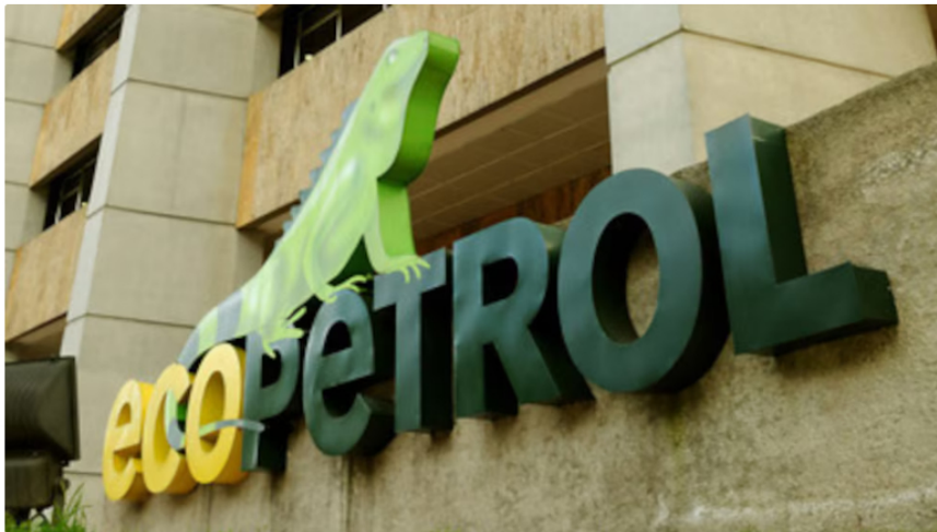
Sede de Ecopetrol en Bogotá