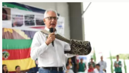
Corte Constitucional abre incidente de desacato contra el ministro de Salud por no reajustar la UPC