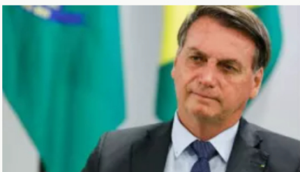
EE.UU. levanta sanciones a Alexandre de Moraes, juez del caso contra Jair Bolsonaro