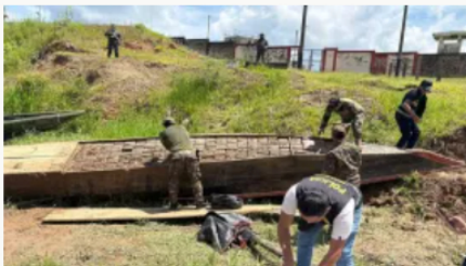
Operación conjunta Colombia-Perú incauta más de dos toneladas de marihuana en la Amazonía