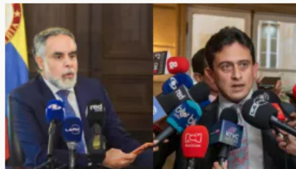
Rifirrafe entre Benedetti y exdirector de la Dian termina en anuncio de denuncia penal