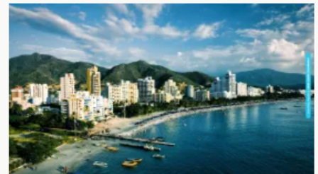
Colombia recibió 3,8 millones de turistas extranjeros entre enero y octubre de 2025